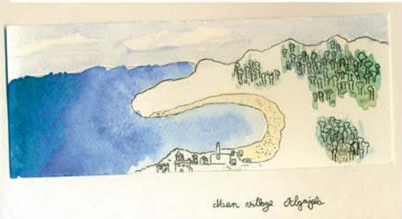
deux village Algajola