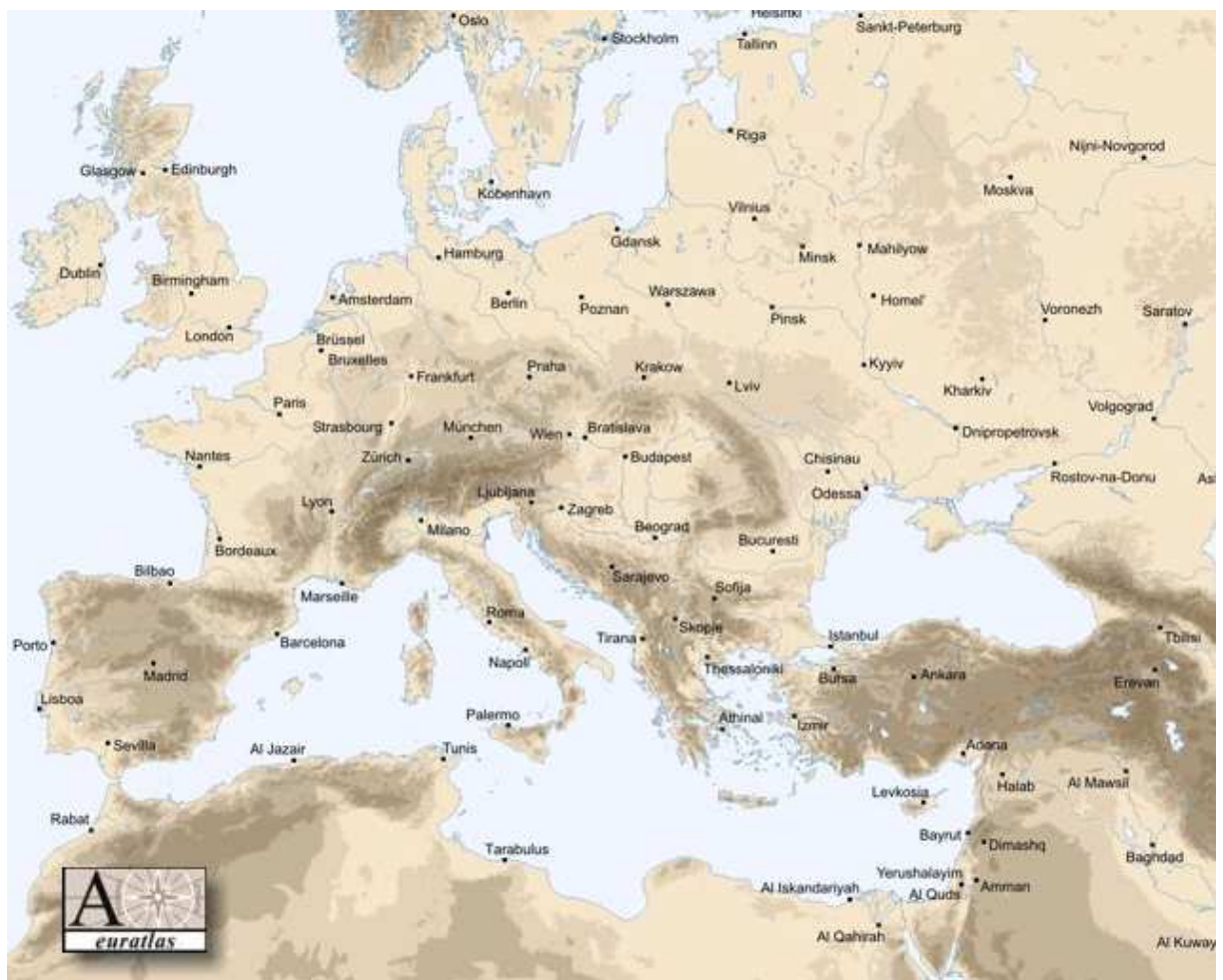
Carte d'Europe Vierge