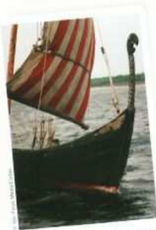
Les Vikings étaient de si bons marins qu'ils ont navigué jusqu'en Amérique (mais ils ne l'ont dit à personne!).

Les peuples germaniques : tous ne se sont pas installés en Allemagne ; en effet :