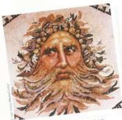
Une mosaïque romaine illustrant un personnage mythique.