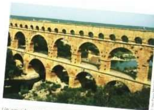
Un aqueduc romain qui est encore là aujourd'hui: le pont du Gard, en France.