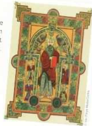
Art celtique vers 700 apr. J.-C.

Les Celtes : leurs descendants vivent aujourd'hui principalement en Bretagne (France), en Cornouailles (Angleterre), en Galicie (Espagne), en Irlande, en Écosse et au pays de Galles, où les langues et la culture celtiques sont encore très présentes.