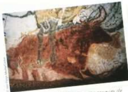
Peintures qui ornent les grottes préhistoriques de Lascaux (France).

Cependant, cette histoire serait longue à raconter; nous allons donc seulement retracer ici quelques-unes de ses périodes les plus marquantes.