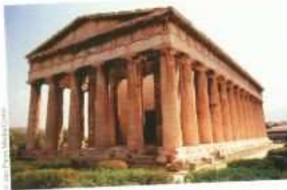
Un temple grec antique qui est encore là aujourd'hui (à Athènes)

Il y a environ 4 000 ans, en Grèce, on a commencé à bâtir des villes. Au début, ces villes étaient gouvernées par des rois. Plus tard, vers 500 av. J.-C., la cité d'Athènes a introduit la «démocratie», qui signifie «gouvernement par le peuple» (les décisions, au lieu d'être prises par un roi, étaient prises par les hommes d'Athènes à la suite d'un vote). La démocratie est une invention européenne importante qui s'est répandue dans le monde entier.