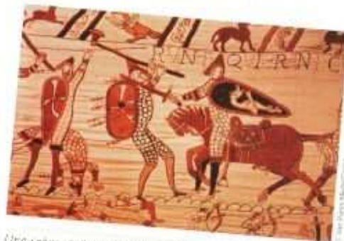
Une scène de bataille tirée de la tapisserie de Bayeux.

Les Normands ou «hommes du Nord» sont des Vikings qui se sont d'abord installés en France (dans la région que l'on appelle Normandie) avant de conquérir l'Angleterre en 1066. Une célèbre tapisserie normande montre des scènes de cette conquête. Elle est conservée dans un musée de la ville de Bayeux.