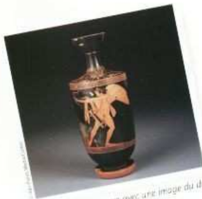
Un vase grec antique avec une image du dieu Enos.