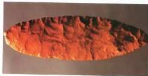
Une arme taillée dans du silex datant de l'âge de pierre.

Les premiers Européens étaient des chasseurs qui vivaient dans des grottes. Sur les parois de certaines d'entre elles, ils ont peint de magnifiques scènes de chasse. Au fur et à mesure, ils se sont tournés vers l'agriculture et ont commencé à élever des animaux, à cultiver la terre et à vivre dans des villages.