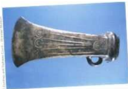
Tranchants de hache en bronze.

Plusieurs milliers d'années av. J.-C. (avant la naissance de Jésus-Christ), les hommes ont découvert qu'ils pouvaient obtenir certains métaux en chauffant différentes sortes de roches dans un feu très chaud. L'airain, un mélange de cuivre et d'étain, était assez dur pour fabriquer des outils et des armes. L'or et l'argent étaient plus tendres, mais magnifiques; en les façonnant, on pouvait obtenir des objets décoratifs.