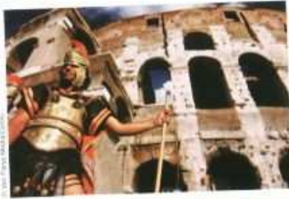
Des ruines de la Rome antique et un soldat romain en costume d'époque.

(Apr. J.-C. signifie «après la naissance de Jésus-Christ»)