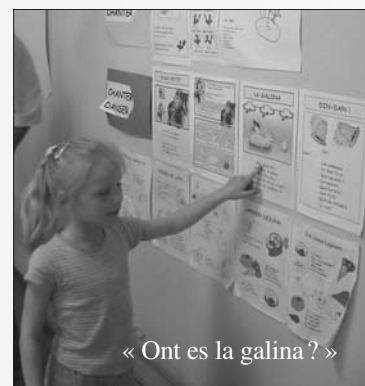
« Ont es la galina ? »