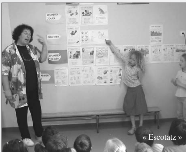
« Escotatz »