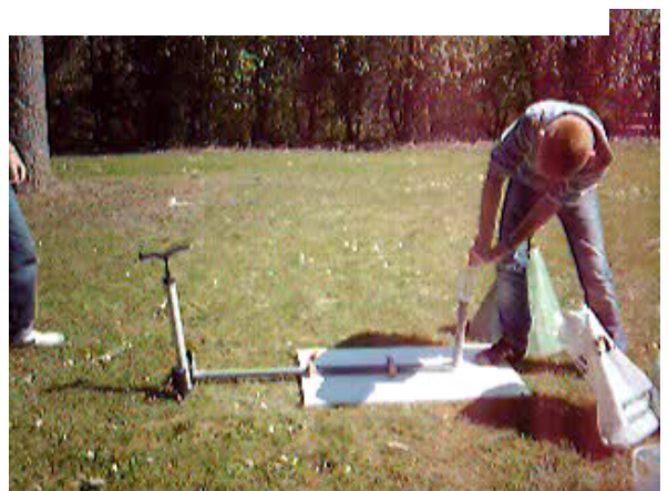
Un essai du modèle analogue