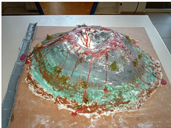
Des maquettes de volcans