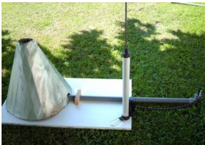
Une des versions du modèle analogue