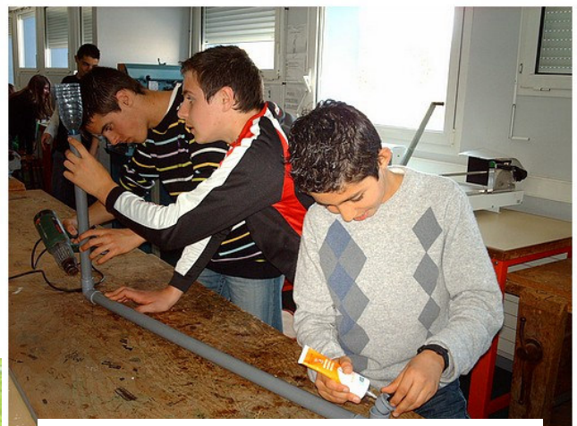
La fabrication du modèle analogue