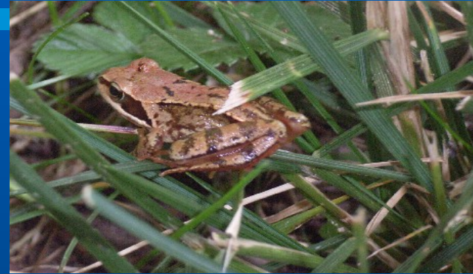
Grenouille rousse – tourbière Massif Central

Plusieurs disciplines pour un objectif : comprendre les enjeux actuels du développement durable