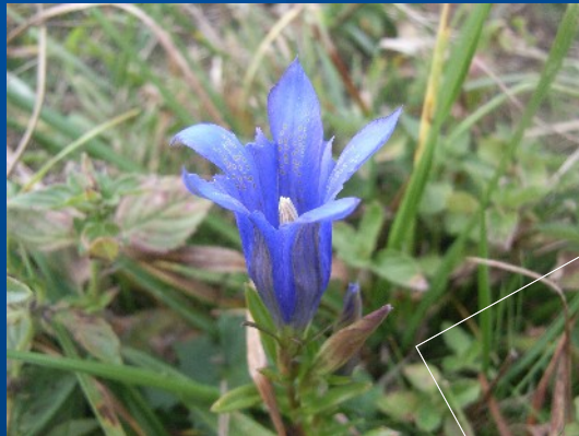
Gentiane pneumonanthe Tourbière Massif Central