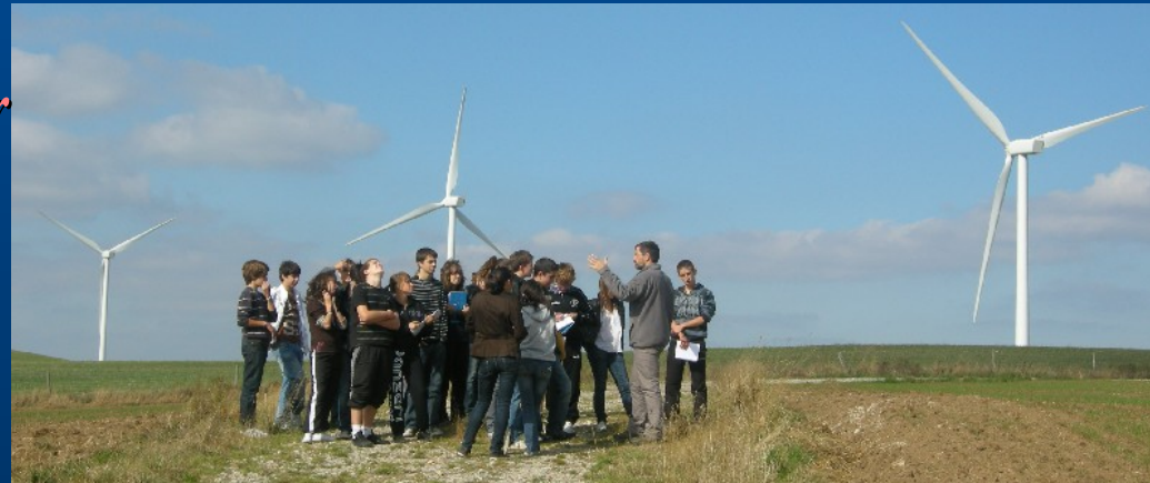
Eoliennes de Viarouge – Massif Central

Plusieurs disciplines pour un objectif : comprendre les enjeux actuels du développement durable