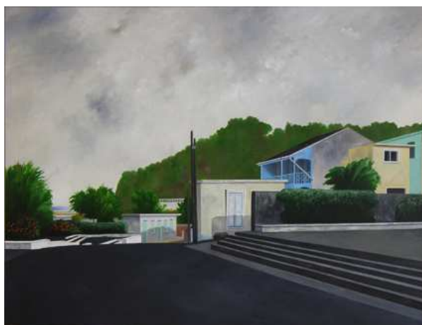
François Malbreil, La Véranda bleue , 1998 Coll. Castres - musée Goya

1 visite + 2 ou 3 ateliers | cycle 3 et secondaire