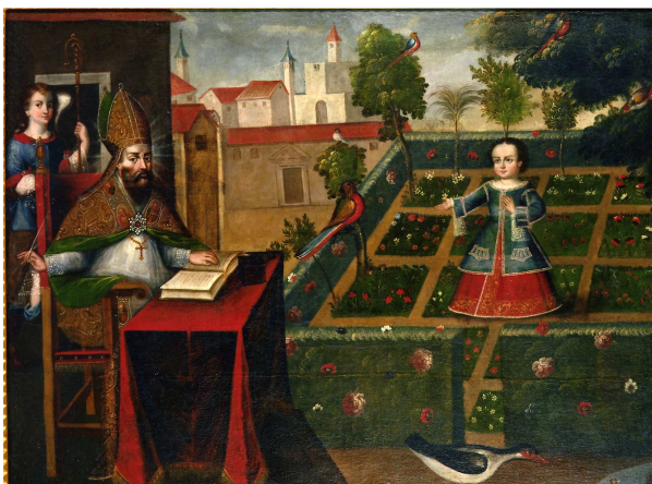
St Augustin et le jardin de la Vierge Marie , Anonyme XVII e , coll. Particulière

1 visite + 2 ateliers | cycle 3 et secondaire