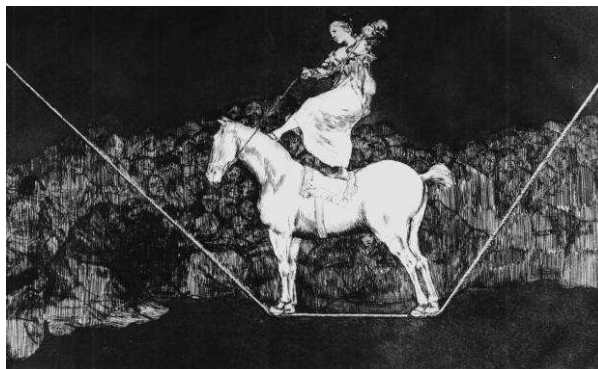
Francisco Goya (1746-1828), Une Reine du cirque vers 1816/1824 Gravure

1 visite + 2 ateliers | cycle 3 et secondaire