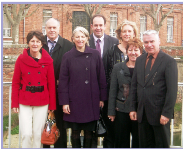
Les intervenants et organisateurs

Contact : CLEE du Lauragais T 05 61 00 10 10