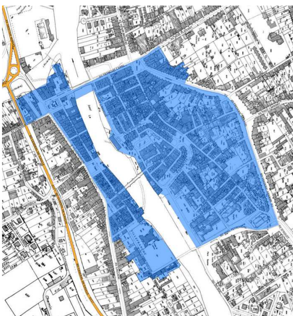
Ancien périmètre (2015-2023)

Le décret du 28 décembre 2023 a permis une extension du périmètre du QPV « Saint-Girons – Coeur de ville » pour le faire correspondre avec celui de l'opération de revitalisation du territoire (ORT)